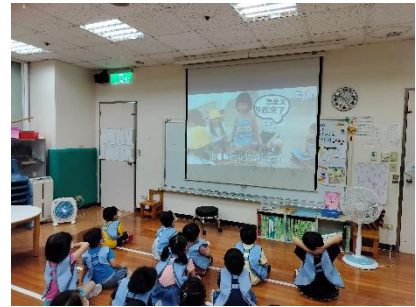
觀賞影片：幼兒園老師的一天