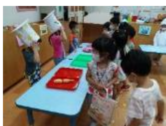
老闆招呼客人買東西