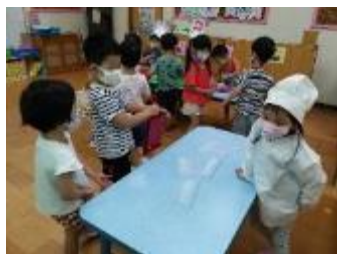
老闆賣完：謝謝惠顧