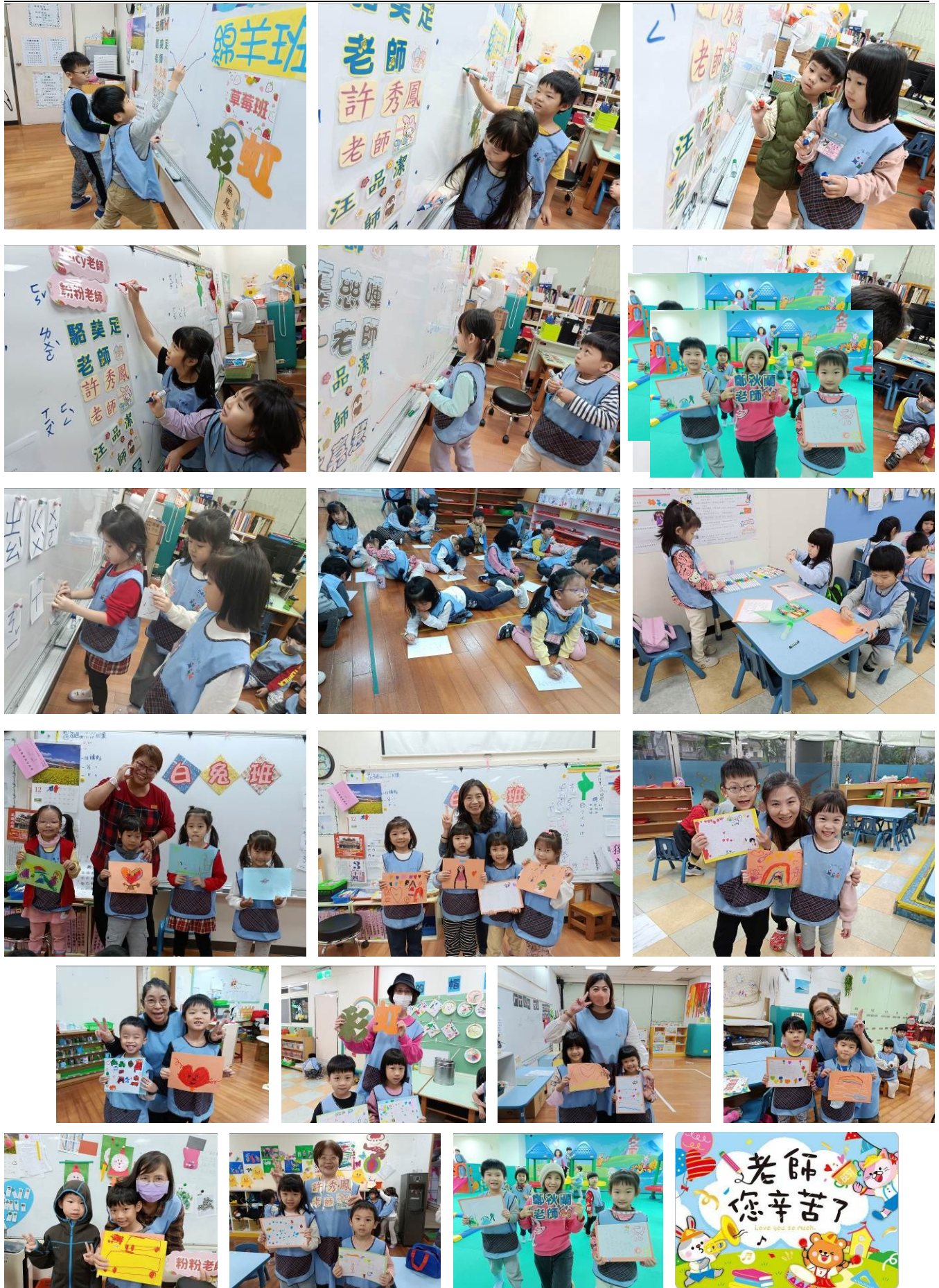
透過活動，幼兒了解當老師的辛苦，同時製作感恩卡片表達對老師的感謝之意喔！