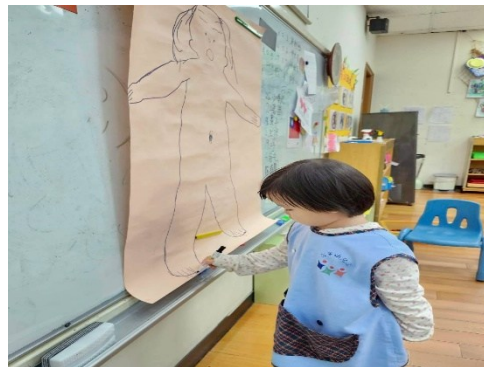
※進行口香糖黏哪裡遊戲